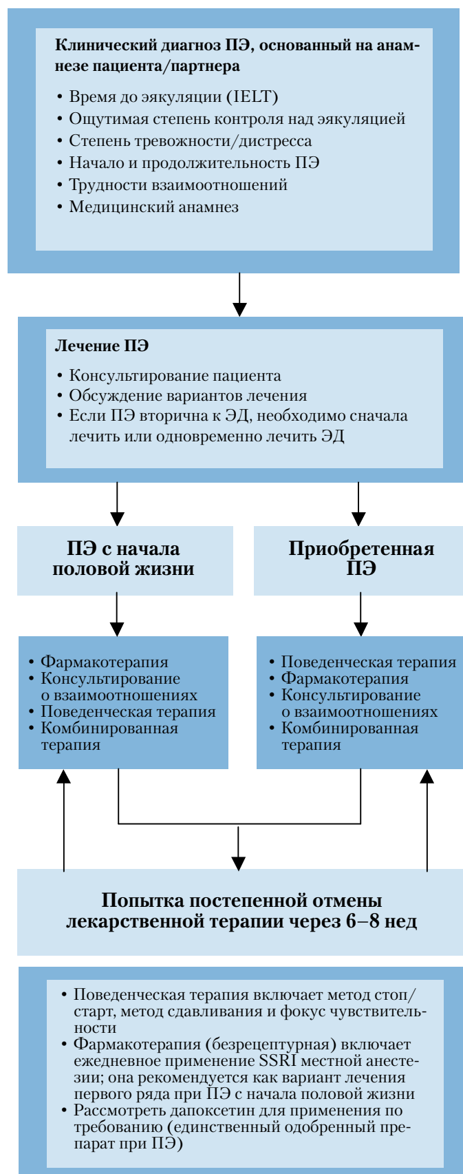
Рис. 4. Лечение ПЭ. Адаптировано по Lue et al. 2004 [42]