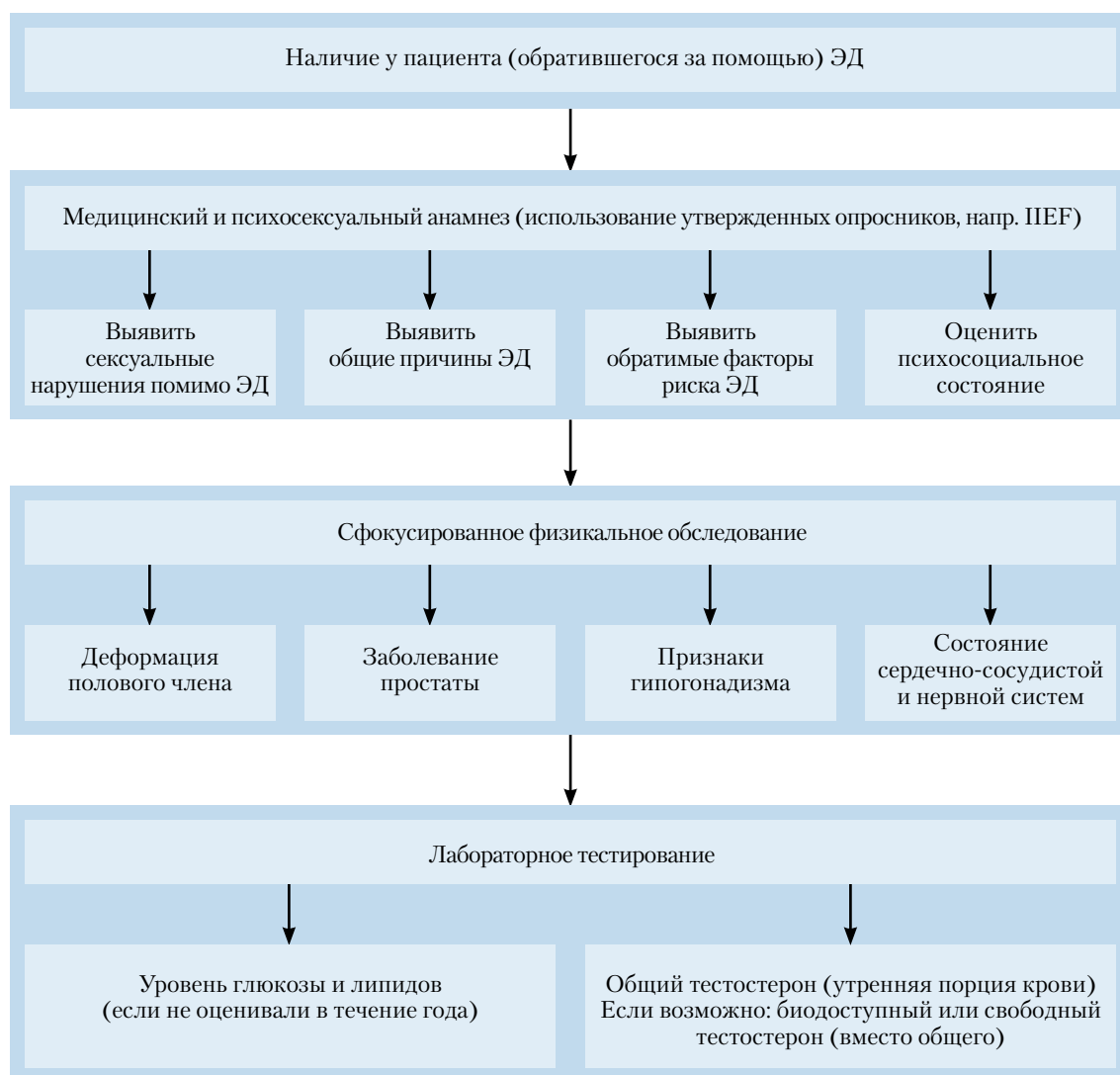
Рис. 1. Минимальная диагностическая оценка (базовое обследование) пациентов с ЭД

На рис. 1 представлена минимальная диагностическая оценка (базовое обследование) пациентов с ЭД.